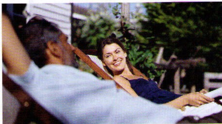
ANGEKOMMEN: Die Wahl des Wohnorts hat entscheidenden Einfluss auf das persönliche Glücksgefühl